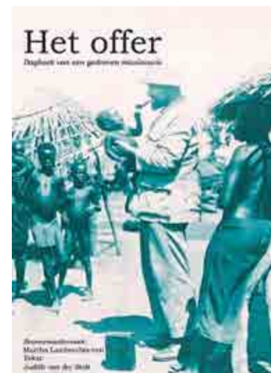
De cover van het boek.

Dagboek bevatte een schat aan informatie